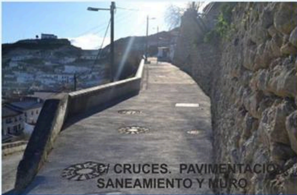
C/ CRUCES. PAVIMENTACIÓN SANEAMIENTO Y MURO