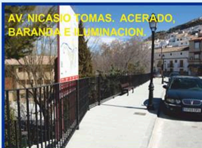
AV. NICASIO TOMAS. ACERADO, BARANDA E ILUMINACION.