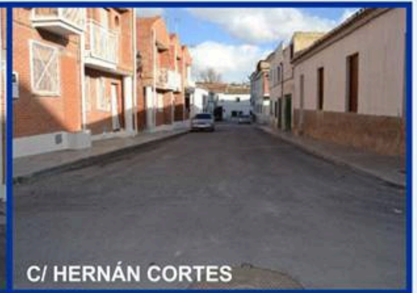
C/ HERNÁN CORTES