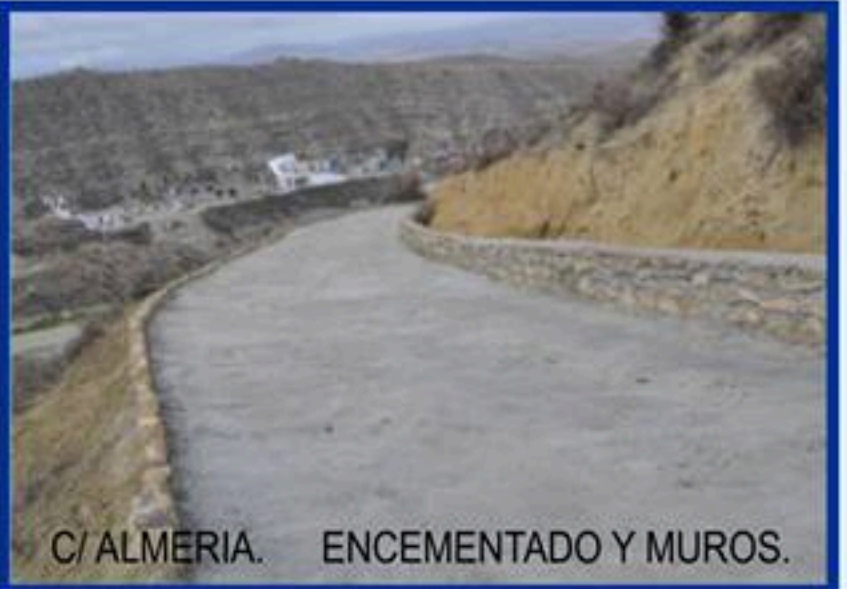
C/ ALMERIA. ENCEMENTADO Y MUROS.