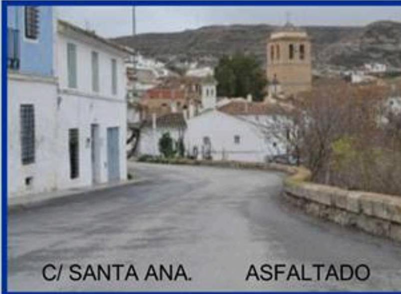
C/ SANTA ANA. ASFALTADO