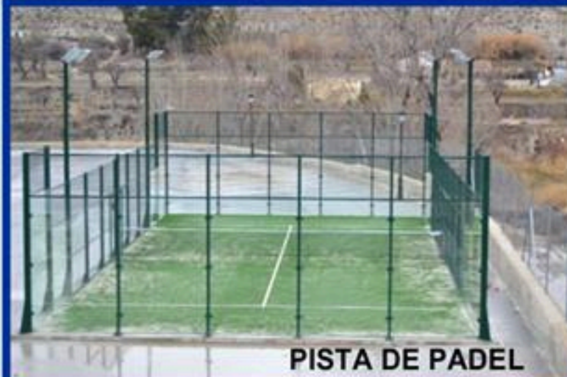
PISTA DE PADEL