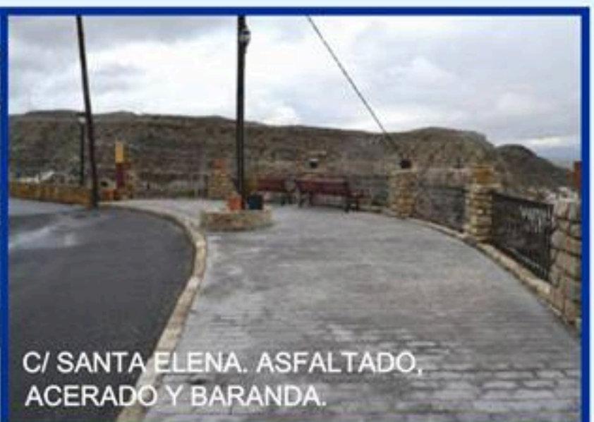
C/ SANTA ELENA. ASFALTADO, ACERADO Y BARANDA.