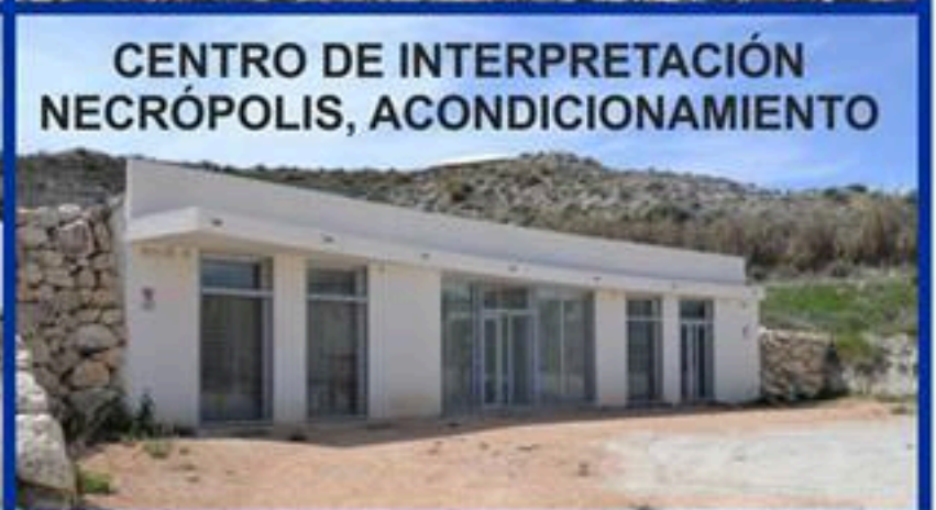
CENTRO DE INTERPRETACIÓN NECRÓPOLIS, ACONDICIONAMIENTO