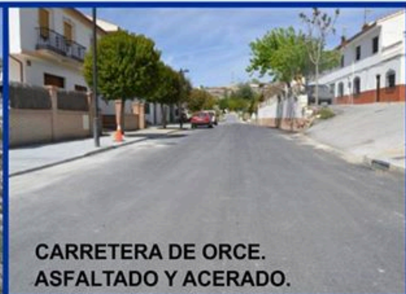
CARRETERA DE ORCE. ASFALTADO Y ACERADO.