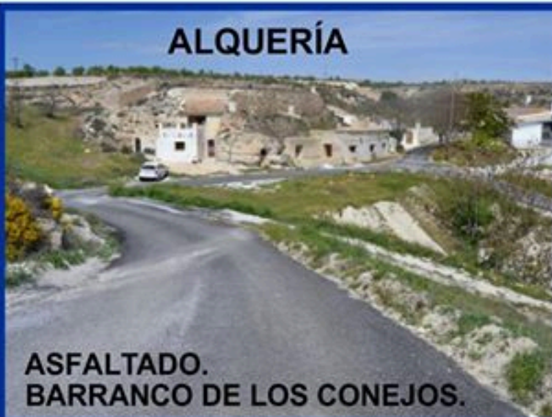
ASFALTADO. BARRANCO DE LOS CONEJOS.