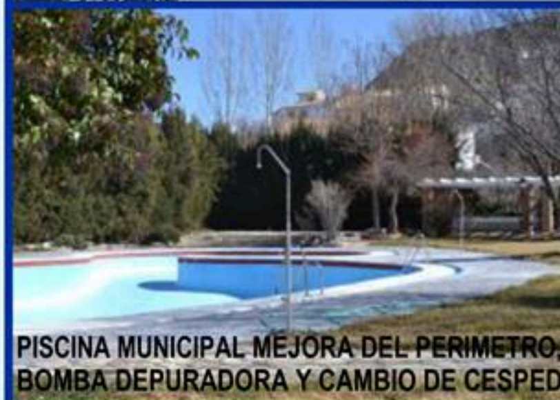
PISCINA MUNICIPAL MEJORA DEL PERIMETRO, BOMBA DEPURADORA Y CAMBIO DE CESPED