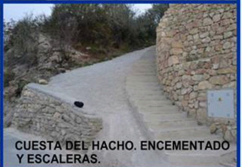
CUESTA DEL HACHO. ENCEMENTADO Y ESCALERAS.