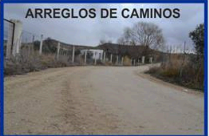
ARREGLOS DE CAMINOS