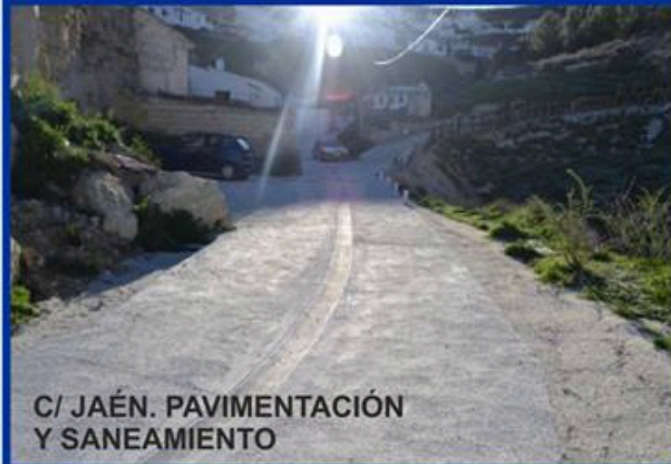
C/ JAÉN. PAVIMENTACIÓN Y SANEAMIENTO