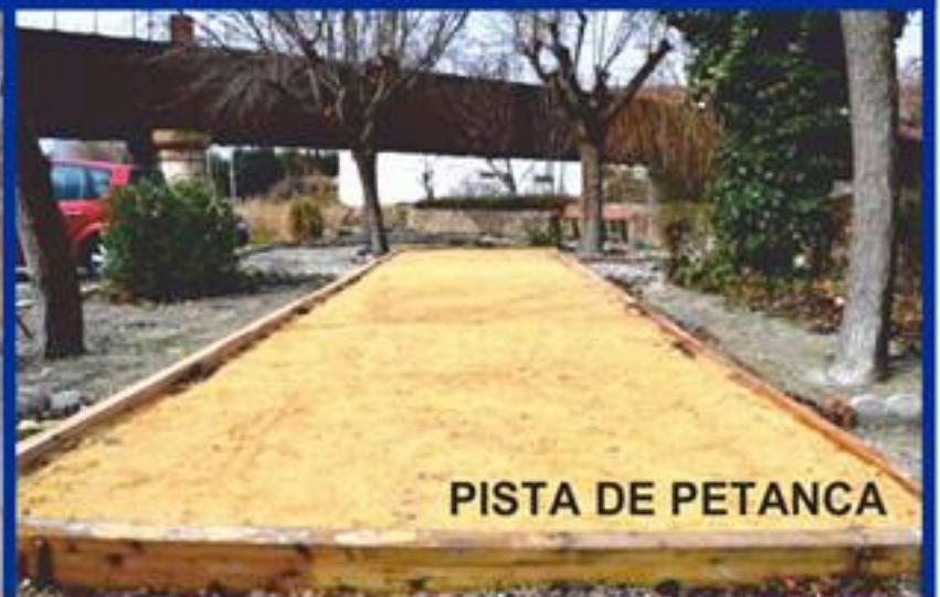
PISTA DE PETANCA