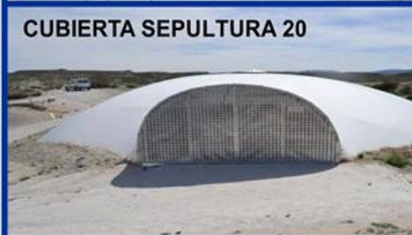
CUBIERTA SEPULTURA 20