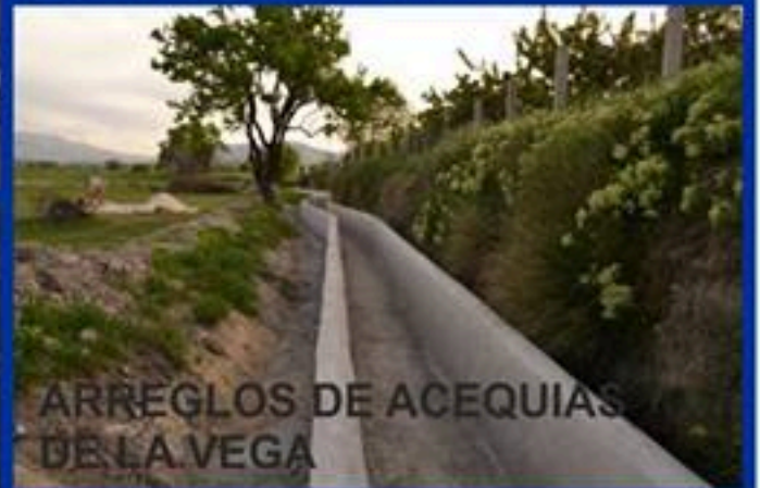
ARREGLOS DE ACEQUIAS DE LA VEGA