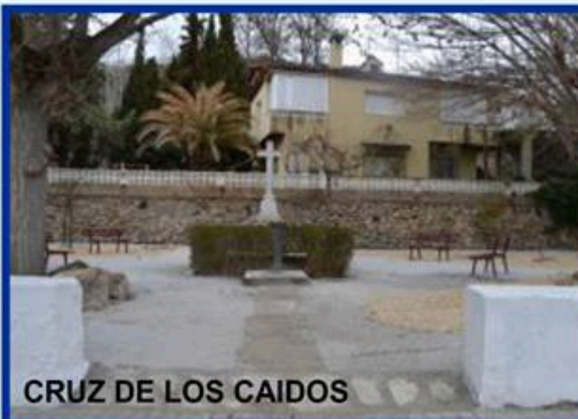
CRUZ DE LOS CAIDOS