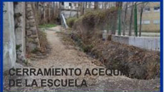
CERRAMIENTO ACEQUIA DE LA ESCUELA