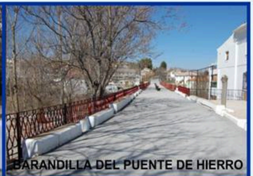
BARANDILLA DEL PUENTE DE HIERRO